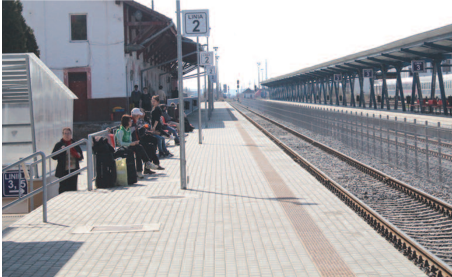
A marosvásárhelyi vasútállomáson is hiába vártak az utasok