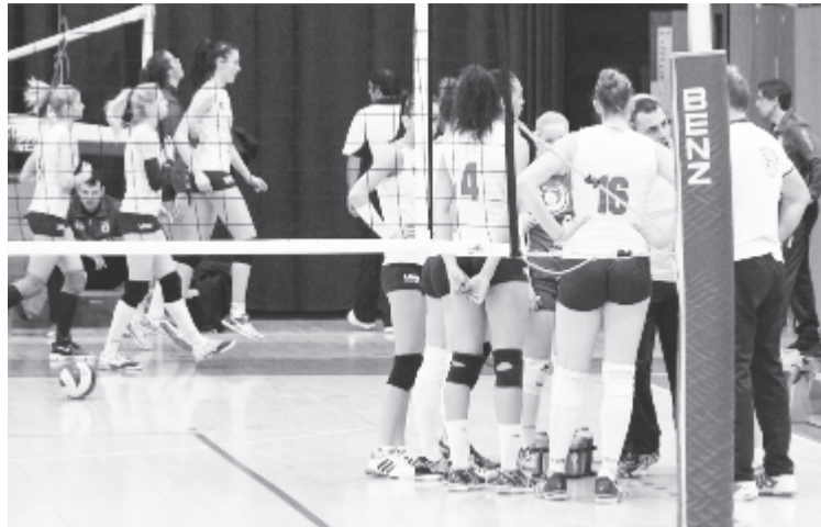
Az edzők menet közben próbálták igazítani a Medicina CSU játékán: nem sikerült.

Igaz, az alapszakasz után már sok értelme nincs a folytatásnak, hisz kiesni aligha lehet, a 7. hely pedig éppen annyira nem ér semmit, mint a kilencedik vagy a tizedik, azt azonban mégsem gondoltuk, hogy a marosvásárhelyi csapat ilyen gyorsan felhagy a küzdéssel. Bár a craiovai játszma vesztés az alapszakasz utolsó fordulójában jelezte a hanyatlást, mégiscsak hátravan még kilenc mérkőzés az idény végéig, és ilyen teljesítménnyel nem nézhetünk egy igazán vidám időszak elé. Sovány vigasz, hogy gyorsan vége lesz, mert szerda-szombat ritmus-