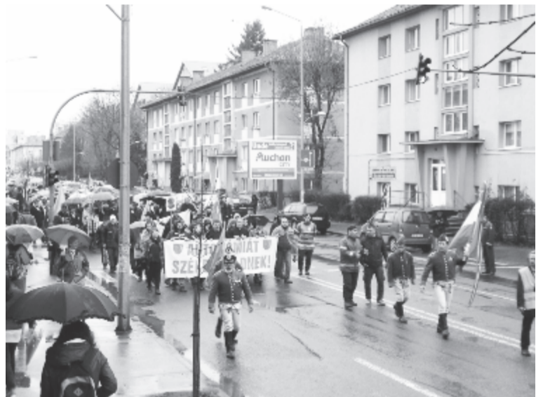
Idén is felvonultak a székely szabadság napján