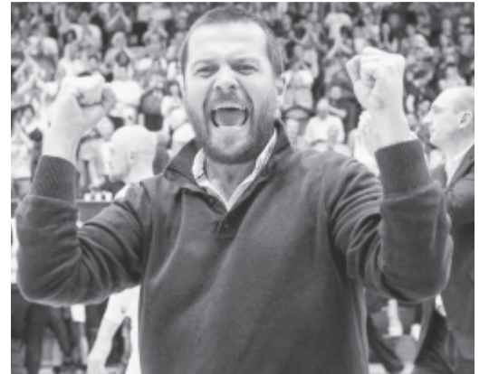
Az új sportvezető, a klub honlapján közzétett felvételen

nyilatkozatában megköszönte, hogy „megbíztak ezzel a nehéz feladattal. Nagyon jól tudom, milyen nehézségekkel küszködik a klub, teljes erővel azon leszek, hogy megmentsem a marosvásárhelyi kosárlabdát, és ebben kérem, hogy mindenki legyen partner”. Jelezte, elképzeléseit a mára meghirdetett sajtótájékoztatón ismerteti.